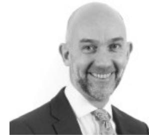
Adrian Crompton Archwilydd Cyffredinol Cymru